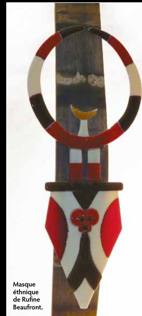
Masque ethnique de Rufine Beaufront.