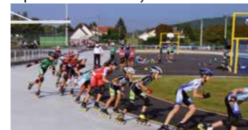
La piste de roller à Thomery