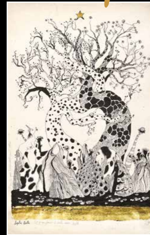
« Et si on jouait à cache coeur »