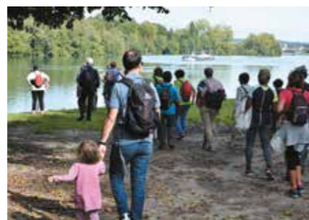
Christian Eloy - Yapafoto