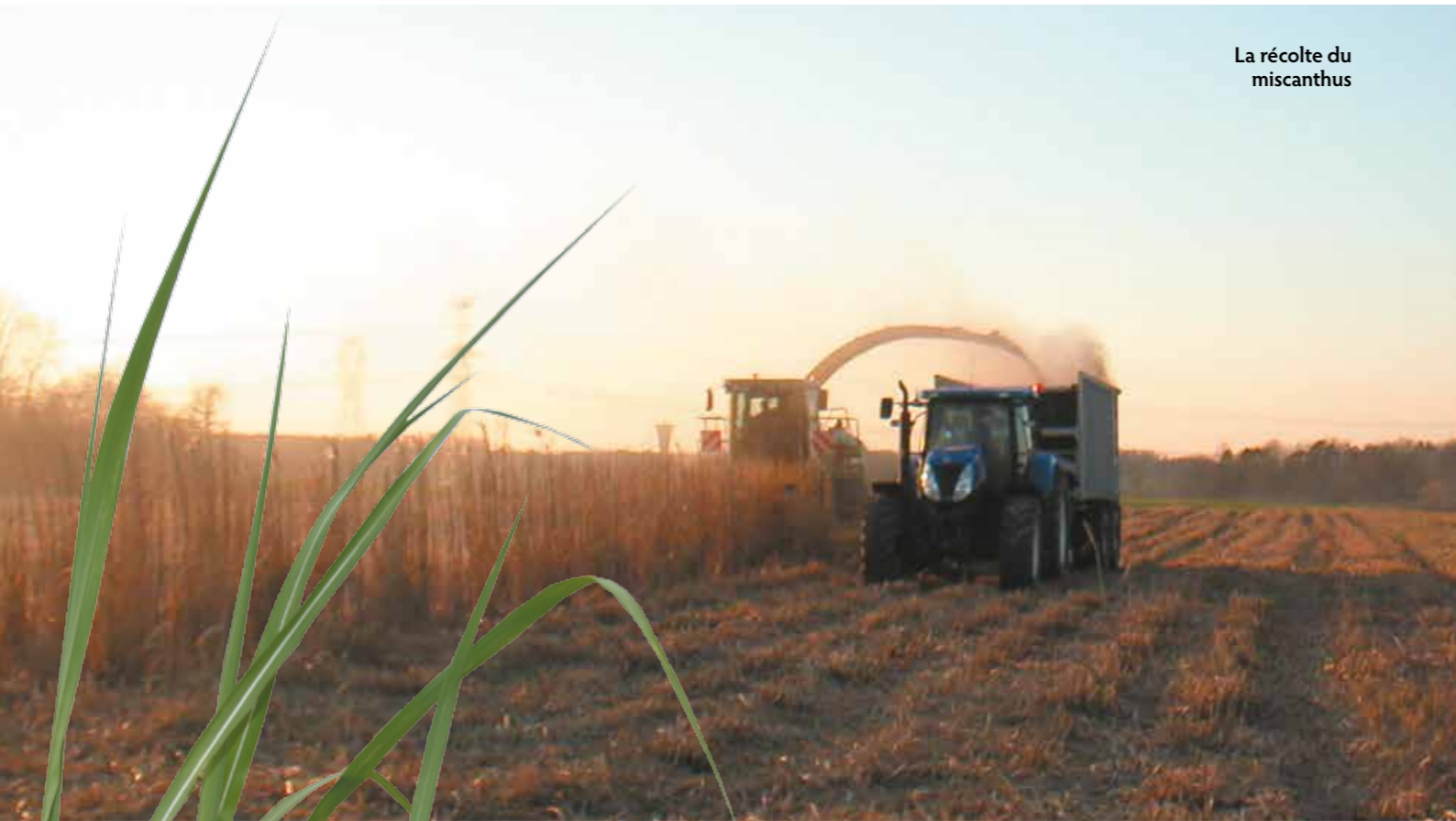
La récolte du miscanthus