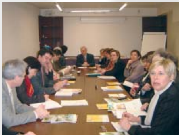
Les élus de Moret Seine & Loing en réflexion avec Seine et Marne Développement sur l'avenir économique du territoire.

Avec les 2 communautés de communes voisines, il est envisagé de créer une pépinière d'entreprises. Cette structure permettrait d'accueillir, de former, d'accompagner les porteurs de projets qui pourraient, ensuite, s'établir sur nos territoires.