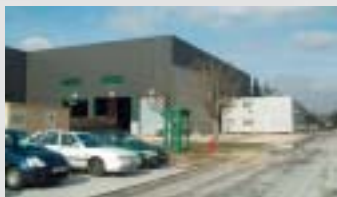
FEHR : un bâtiment... Bientôt un deuxième.