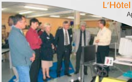
A la découverte de la technologie de pointe...

La Fête de la Science, organisée en octobre 2004, a permis de mieux faire connaître les entreprises sur le site.