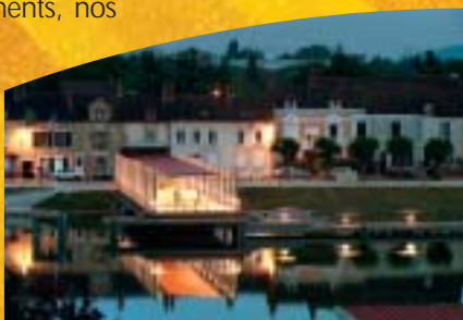
Des équipements de qualité bien intégrés dans l'environnement.

Les 28 postes d'amarrage permettent d'accueillir de la barque jusqu'au bateau à passagers de 70 m. Les plaisanciers y trouvent de l'eau, de l'électricité et des douches. En 2004, 559 bateaux soit 25% de plus qu'en 2003, ont fréquenté les Haltes de mai à septembre. Ce sont ainsi des milliers de touristes à 55% étrangers (à fort potentiel économique) qui ont consommé dans nos commerces de proximité, qui ont visité nos monuments, nos musées et qui sont repartis, en se promettant de revenir... faisant une large publicité de leur satisfaction ! La navigation de plaisance... une activité économique s'inscrivant dans un développement durable qui irrigue l'ensemble de notre territoire.