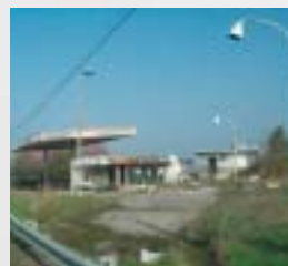
Plus jamais ça !

En concertation avec la Communauté de Communes des 2 Fleuves, une étude, va permettre de lancer la réhabilitation des stations services abandonnées le long de la RN6. Depuis plus de 10 ans, Moret Seine & Loing soutient les Restos du Cœur . Cette année, l'équipe de Champagne sur Seine couvrant le secteur Champagne sur Seine, Thomery, Vernou la Celle sur Seine, Saint-Mammès a aidé 87 familles, celle d'Ecuelles, Moret, Villemer, Villecerf, Episy, Montarlot, Ville-Saint-Jacques a aidé 21 familles (dont un certain nombre extérieures au territoire) et l'équipe de Veneux les Sablons 30 familles. Grand merci aux bénévoles qui apportent écoute, aide et chaleur humaine aux plus démunis d'entre nous. Une inter campagne se déroulera à Ecuelles (le mercredi après-midi, tous les 15 jours) et à Champagne sur Seine (tous les jeudis matin).