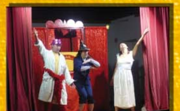
Les Bagatelli, à Saint-Mammès