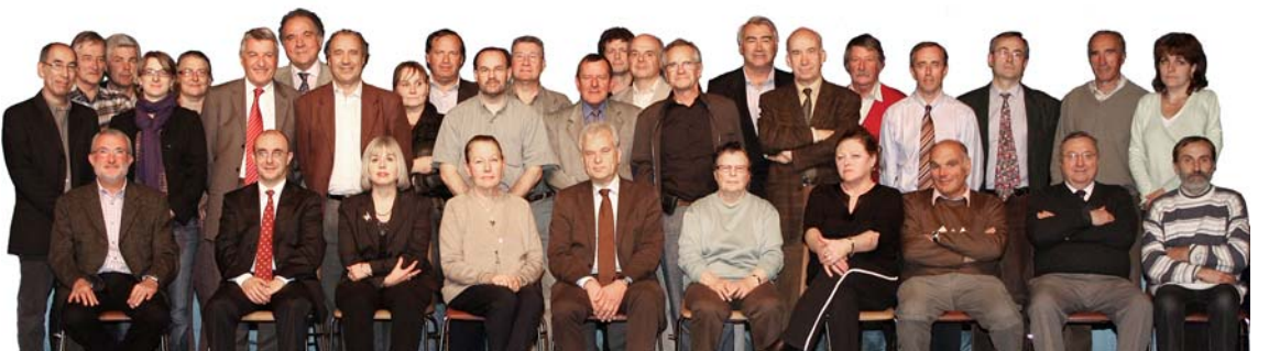
Le Conseil Communautaire de Moret Seine & Loing, le 20 octobre 2008

Les délibérations de notre conseil, très souvent prises à l'unanimité, témoignent d'une écoute attentive de la parole de tous les élus. Ce fonctionnement est à l'opposé d'une pratique hégémonique d'un autre temps qui garde encore malheureusement des adeptes.