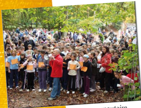
Le départ du Cross communautaire